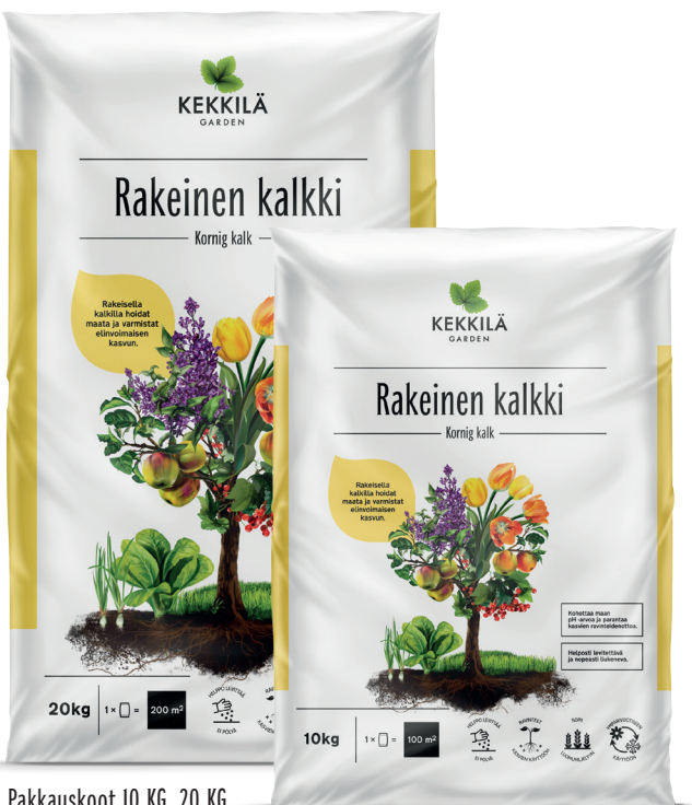
Pakkauskoot 10 KG, 20 KG

Kasvimaat, koristepensaat, ruusut, hedelmäpuut, kukkapenkit 0,5–1 dl m 2