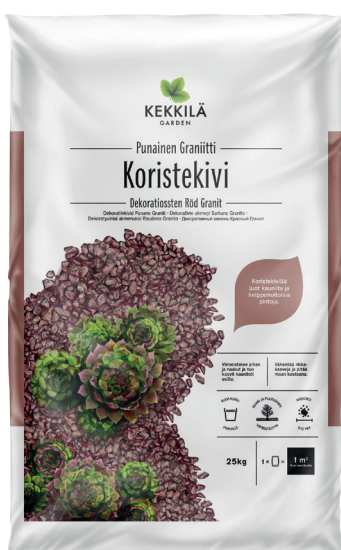
Pakkauskoot 25 KG